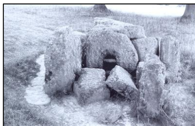
Tomba con Foro dell'anima in Belgio