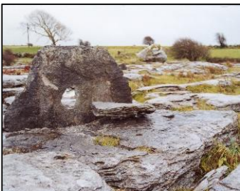
Tomba con Foro dell'anima in Irlanda