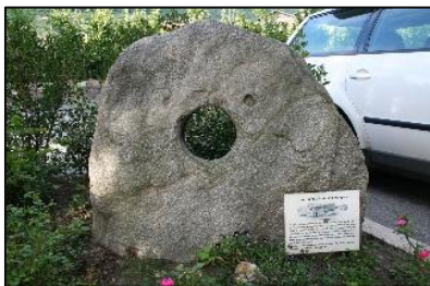
Lastra tombale con Foro dell'anima esposta a Lagundo (BZ)

Diversa è la grandezza dei fori praticati sulle lastre frontali delle "Tombe dei Giganti" in Sardegna, le diffuse tombe della cultura nuragica (cfr. immagine sotto, a destra). In questo contesto è concretamente dimostrabile il passaggio dall'esterno all'interno e viceversa di sacerdoti addetti alla cerimonia funebre e alla conservazione di più sepolture avvenute in periodi diversi.