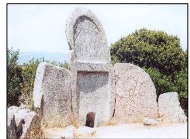
Tomba dei Giganti in Sardegna