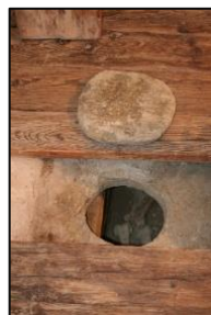
Tomba con Foro dell'anima di epoca medievale conservata a Tirolo